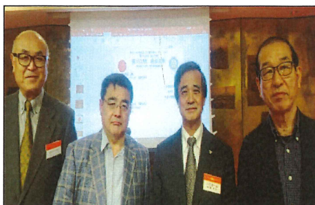
お誕生日：木村会員・山口会員・三澤会員