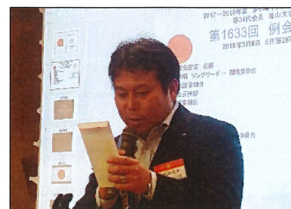
スマイル報告：嵯峨野会員