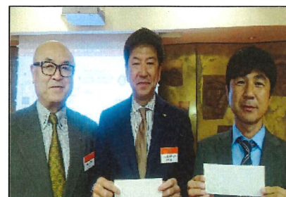
奥様お誕生日：松岡会員・中川会員