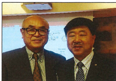
小川会員は奥様と同じお誕生日です