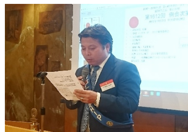
出席報告：嵯峨野会員