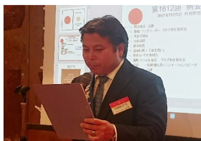
委員会報告：嵯峨野親睦委員長