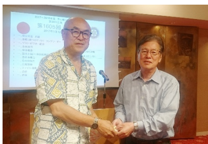
出席表彰 倉知会員