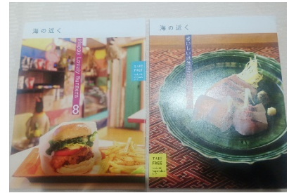
フリーマガジン 海の近く