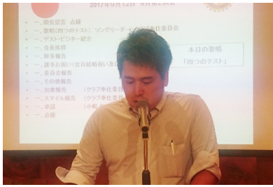
会員増強 阿波連委員長 会員名簿の刷新のご説明