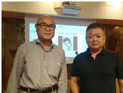
9月誕生月の山口会員