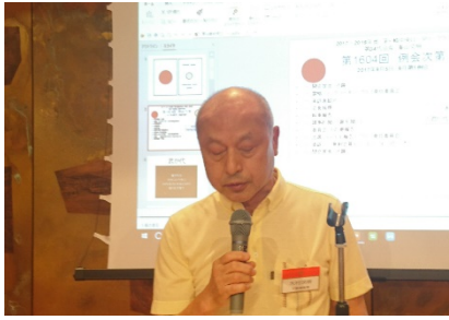
委員会報告 大村会員 公共イメージ：植樹会のご案内