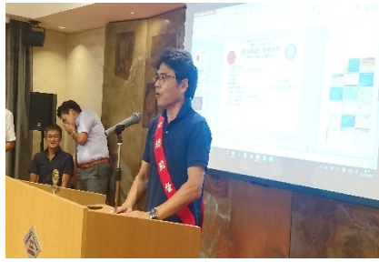
神尾会員 ミスマターズ報告