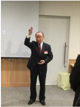
ソングリーダー倉澤会員