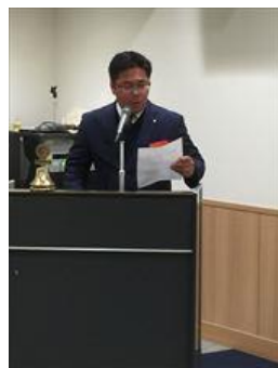
出席報告 小山会員