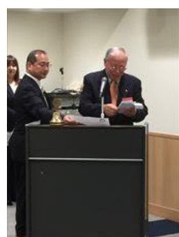
スマイル報告 長田会員