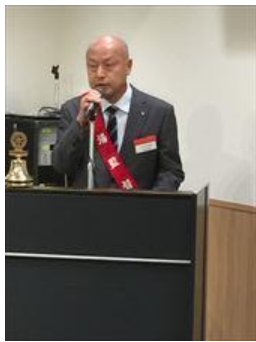
ゲスト紹介大村会員